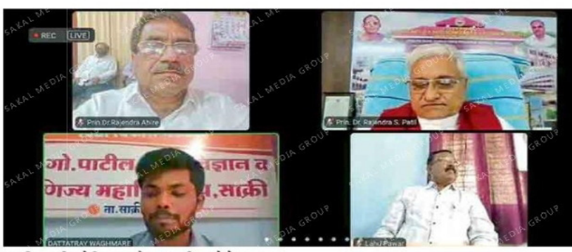
साक्री : राष्ट्रीय वेबिनारमध्ये सहभागी झालेले मान्यवर.